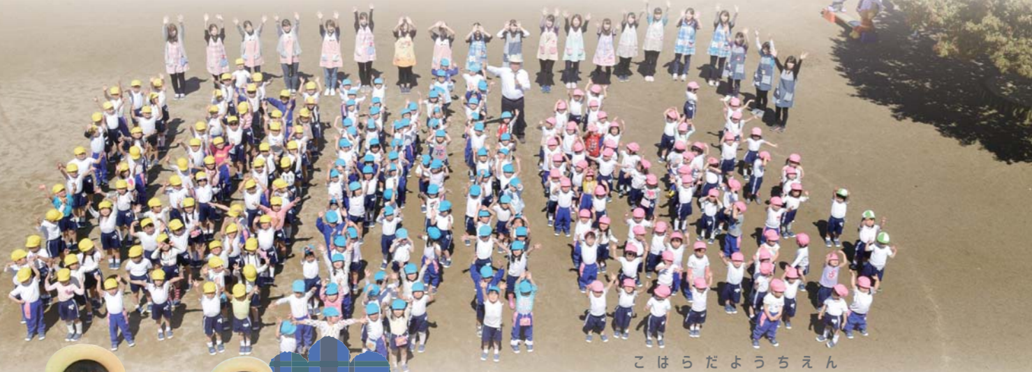
こはらだようちえん