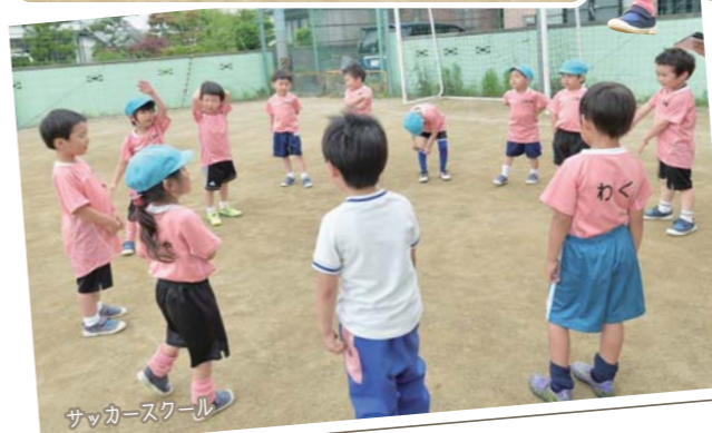
サッカースクール