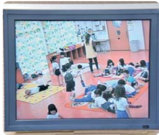
預かり保育の様子を、入り口のモニターからも確認できて安心!

子育て支援の一貫として、預かり保育(延長保育)を行っています。仕事帰りにあわせた時間でお迎えに行けます。