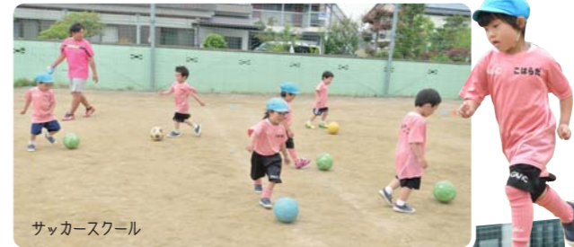
サッカースクール